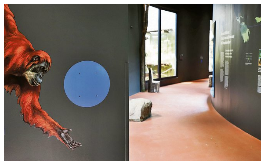
Blick in einen der Besuchergänge

Von den rund 300.000 Euro, die der Zoo jährlich durch den freiwilligen Artenschutzzeuro einnimmt, fließen rund 40.000 an das Projekt auf Sumatra und nun auch 20.000 an das Center in Vietnam. „Es ist uns wichtig, dass wir die Partner vor Ort kennen und uns regelmäßig austauschen“, betont Thomas Brockmann. „Schließlich soll das Spendengeld unserer Besucher wirksam und nachvollziehbar eingesetzt werden.“