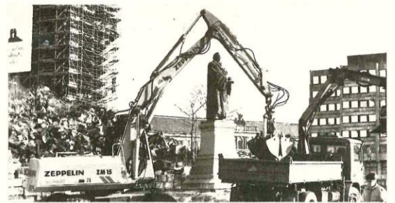
Bereits im Januar 1993 wurde mit den Vorarbeiten für den Wiederaufbau begonnen.