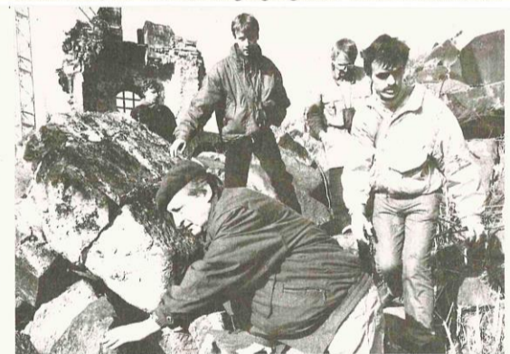
Hunderte Dresdner nutzten 1993 die Möglichkeit, vor dem Beginn der Bauarbeiten den Trümmerberg zu betreten.

Sobald der erste Stein gesetzt war, war ich mit vollem Herzen dabei.