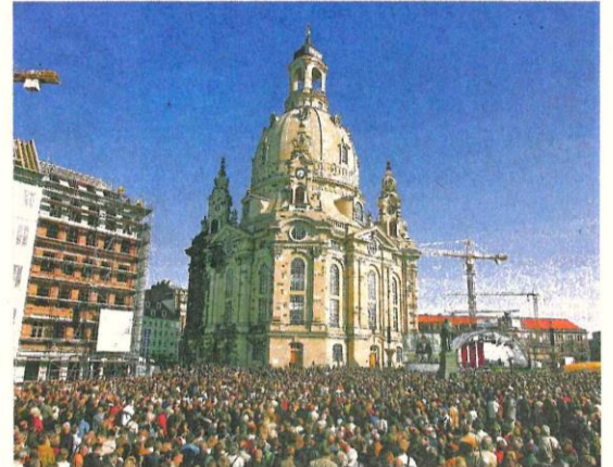
Am 30. Oktober 2005 wurde die Frauenkirche nach zwölf Jahren Bauzeit feierlich wiedereröffnet.