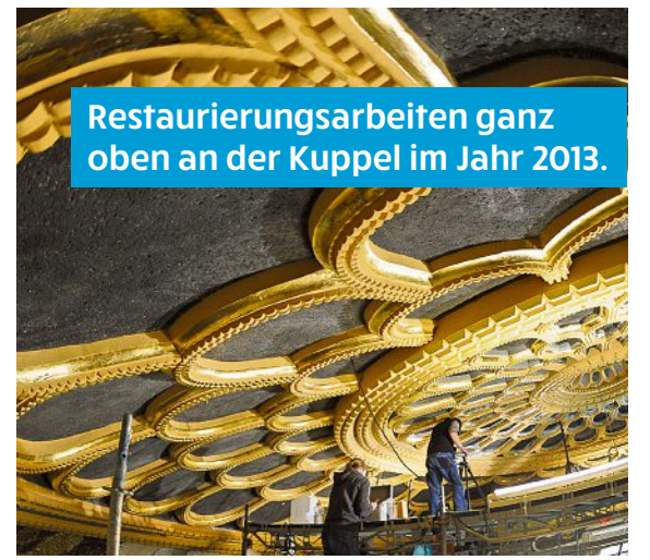
Restaurierungsarbeiten ganz oben an der Kuppel im Jahr 2013.

Die letzten Handgriffe sind erledigt, feine Farbgebungen gestaltet und die Restauratoren sind noch ein letztes Mal jedes Detail durchgegangen – die Görlitzer Synagoge erstrahlt wieder in voller Pracht.