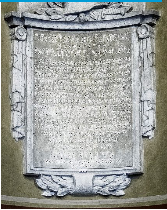
Gedenktafel in der Görlitzer Synagoge

Wer künftig das Kulturforum Görlitzer Synagoge besucht, wird auch multimedial auf Spurensuche durch die jüdische Geschichte der Stadt gehen können und die ehemalige Synagoge in ganz unterschiedlichen Dimensionen selbstständig entdecken können. Einzelne Ornamente, besondere bauliche Elemente und Sichtachsen sind Ausgangspunkt für eine intensive Spurensuche im Gebäude. Das Neue wurde mit dem Ursprünglichen verbunden. So befindet sich in einer Wandnische eine Gedenktafel