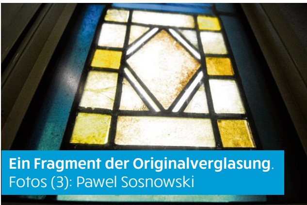
Ein Fragment der Originalverglasung.

Die Restaurierung der Synagoge ist die zeitlich längste Baustelle der Stadt Görlitz. Seit einem Brandanschlag in der Pogromnacht 1938, fand in der "neuen Synagoge" nie wieder ein Gottesdienst statt. Das Feuer wurde damals von der Feuerwehr gelöscht und auch wenn die Umstände der Rettung nicht endgültig geklärt sind, macht es den imposanten Bau so doch zum einzigen jüdischen Gotteshaus Sachsens,