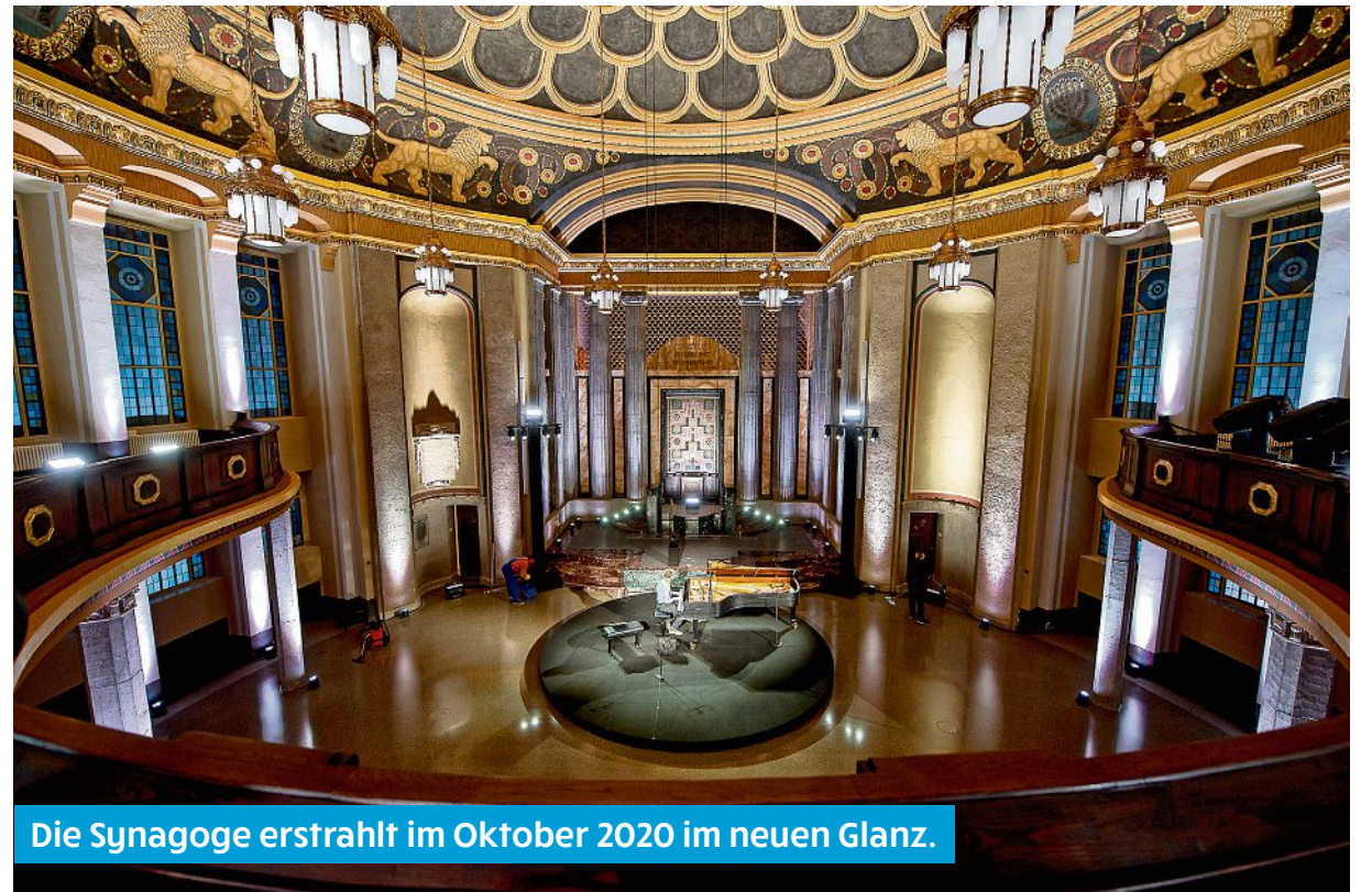
Die Synagoge erstrahlt im Oktober 2020 im neuen Glanz.